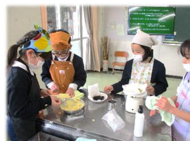
【3年生： 黒豆クッキング】