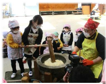
【1・2年生と幼稚園： おもちつき】