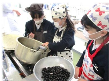
【3年生： 黒豆みそづくり】