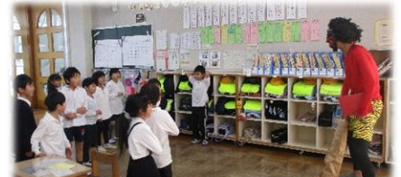
【1年生の教室にも鬼が登場】

2月3日の前日、朝会で「節分」について話しました。元来、季節の分かれ目である「立春・立夏・立秋・立冬の前日」を指していましたが、現在は春の始まりである立春の前日のみを指すということ、東北地方では「豆」ではなく「落花生」をまく地域もあるということなど。そして、いろいろな鬼の中でも「心の中の鬼」を退治することが一番大変そうだということ。自分には「心の鬼」はいないよと言う人も、もしかしたら、何かのきっかけで出てくるかもしれません。そんなときは、「心の鬼」を追いつくという強い気持ちをもって、「心の鬼」退治をしようと話しました。