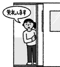
入室退室時には あいさつをする