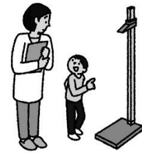
室内の備品などに 勝手にさわらない