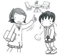
悩みや話がある時