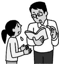
担任の先生に ことわってからくる