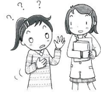
からだや心について 知りたい時