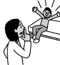
保健室ではさわがず しずかにすごす