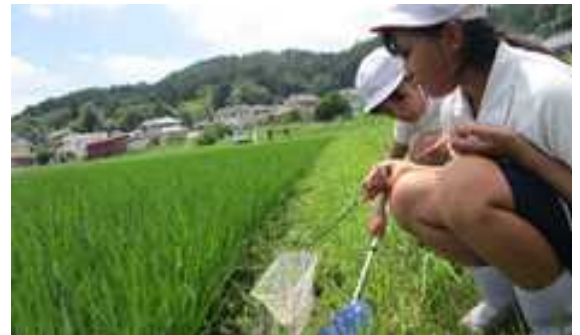
(田んぼの生き物を捕まえているところ)

7月3日(水)、5年生が生き物調査のため、給食用のお米「農都のめぐみ米」を生産されている西荘の水田に行きました。「農都のめぐみ米」とは、農薬や化学肥料を基準の2分の1以下にし、水田の生き物に配慮した米作りを通して作られた丹波篠山のブランド米です。現在、丹波篠山市の給食に出されているお米は、全て「農都のめぐみ米」です。さすが減農薬だけあって、アメンボ、オタマジャクシ、アマガエル、トノサマガエル、コオイムシ、タニシ、ヤゴ等、たくさんの生き物を捕まえることができました。加えて、市役所の方から、お米に良い生き物や良くない生き物についても教えていただきました。今後、社会科「米作り」の学習につながる素晴らしい学びの機会となりました。西荘共同作業の皆様・市役所の皆様、大変お世話になりました。ありがとうございました。