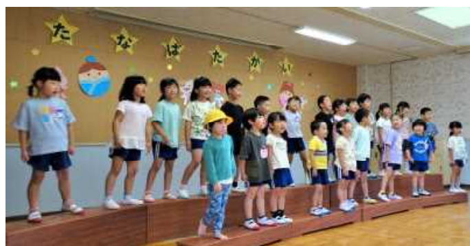
(全員で園歌を歌っているところ)

7月5日に幼稚園では、多くの保護者の皆様をお招きして七夕会を開催いたしました。七夕会でははじめに子ども達が歌と合奏・楽器遊びを発表しました。年長：さくら組では、手話の披露もありました。元気一杯、楽しそうに歌ったり演奏したりする姿がとても印象的でした。後半は、PTA役員の方々によるお楽しみ会でした。曾地中の「クワモンペ」に行ってお「ホットドッグ作り体験」をしました。計画から準備、当日の進行まで大変お世話になりました。子ども達にとって、とても楽しい思い出に残る半日となりました。