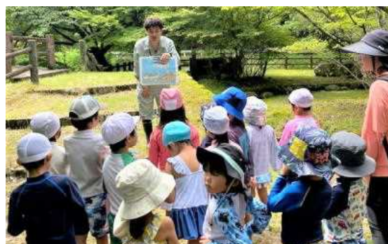
(水辺の生き物の話を聞く園児達)

先日、幼稚園の園外保育で後川新田の「かじかの里」に行ってきました。幼稚園を出発したときの気温は30度を超えていましたが、「かじかの里」は木陰がたくさんあり、羽束川流れている冷たい水の影響でとても涼しかったです。暑い夏に、ぜひ一度行ってみてください。