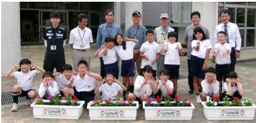
(人権擁護委員さんと集合写真)

5月22日(水)、人権擁護委員さんにお越しいただき、人権の花の苗植えをしました。一緒に植えるだけでなく、花が喜ぶ植え方や、お世話の仕方について丁寧に教えていただきました。植えたプランターは、児童玄関前に写真付きで飾っています。4年生達も水やりの世話などを頑張り、とてもきれいに咲いています。小学校に立ち寄ったときにはぜひご覧になってください。人権擁護委員の皆様、この度は本当にありがとうございました。