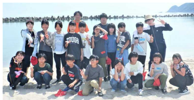
(竹野浜での集合写真)

5年生が6月10日から4泊5日で日本海の竹野に自然学校に行きました。自然学校ではシュノーケリングやカヤック、カヌーなどのマリンスポーツをしたり、カレー作りや釣りを体験したりしました。猫崎灯台(兵庫県最北端の灯台)にも行きました。5日間学校を離れ、遠く竹野の地で友達との共同生活を送り、大きく成長した5年生と出会うことができました。