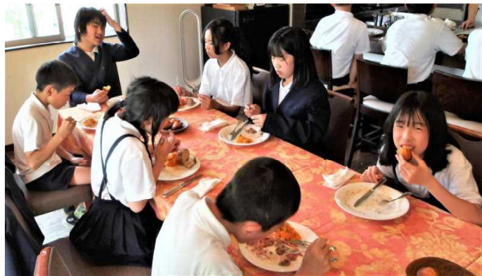
(6/12 フランス料理をいただいているところ)