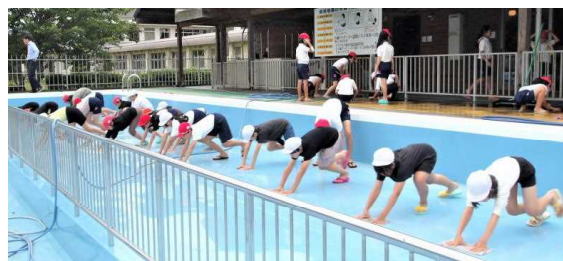
(小プールをぞうきん掛け)

プール開きは6月24日(月)です。「早く入りたいな～！」そんな声があちこちから聞かれたプール掃除でした。