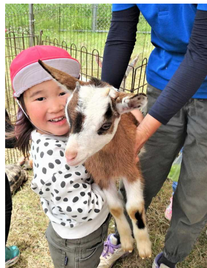
(移動動物園：山羊を抱いているところ)

梅雨になると雨の影響から洗濯物が乾きにくくなったり、外に出るのが億劫になったりします。日々の暮らしの中で、あまり梅雨に良いイメージがないという人もいるのではないのでしょうか。しかし見方を変えれば悪いことばかりではありません。子ども達にとっては、紫陽花、カタツムリ、カエル、ホタルや梅雨特有の自然の変化を観察するなど、季節の変わり目を実感する貴重な体験ができる絶好の機会です。また、室内で過ごす時間が増えるため、読書や創造的な工作活動等に没頭できる時期でもあります。これからも季節の特徴やよさを活かしつつ、充実した保育活動・教育活動を行っていきます。