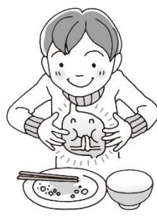
食べすぎに気をつけよう！！