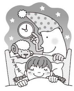
よふかしはしない！