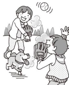
外で体をうごかさう！