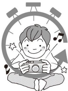
テレビやゲームは時間を決めよう！