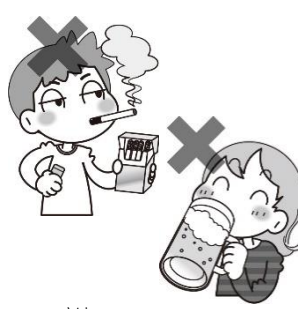
お酒やタバコはぜったいダメ！