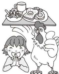
朝ごはんを食べよう！