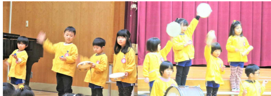
(さくら組 合奏 勇気100%) (すみれ組 合奏 ドラえもん)

12月9日（金）に保護者の皆様をお招きし、かやのみ幼稚園クリスマス会を実施しました。子ども達の素敵な歌や合奏の発表が終わった後は「メリークリスマス♪」とサンタさんが登場し、みんな大興奮でした。サンタさんからクリスマスプレゼントにこま、カルタ、シャボン玉を頂きました。半日、楽しい時間を過ごしました。