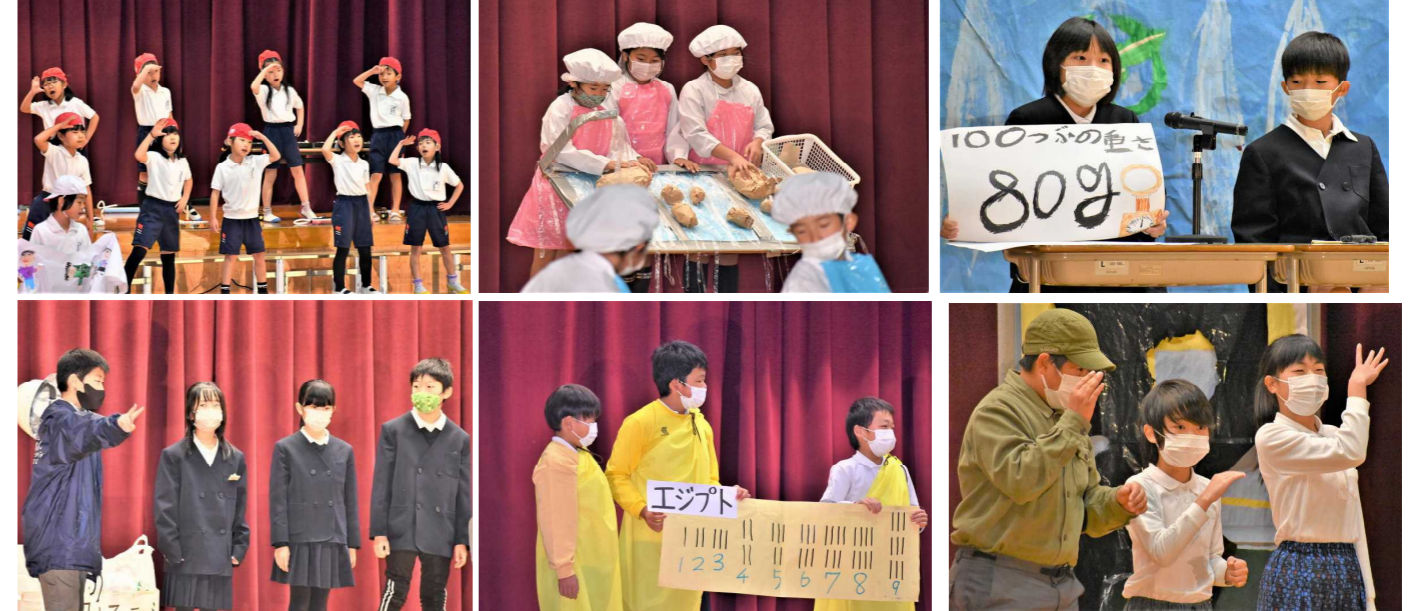
(1年生以外は、コロナウイルス感染拡大防止のためマスクを着用して演技をしました。)

くさんの舞台道具は、何ヶ月も前から少しずつ準備をしていました。4年生は社会科劇「わたしたちの大切な資源」です。ゴミの処理についての発表です。発表の途中で使われていたスライドは、子どもたちだけで作りました。5年生は算数科劇「1と0」です。5年教室と世界、現代と過去をつないだ舞台設定で、5年生らしい元気一杯の発表でした。そして、6年生は総合発表「私たち15人の平和への思い」です。校外学習や修学旅行で勉強した平和学習のことを劇にしました。演じるだけでなく、子どもたち一人一人の平和についての思いを伝えました。テーマの大きさもさることながら、発表のクオリティーはさすが最高学年の発表でした。学習発表会を通してそれぞれの児童に「表現する力」が付いてきたと感じています。たくさんのご観覧ありがとうございました。