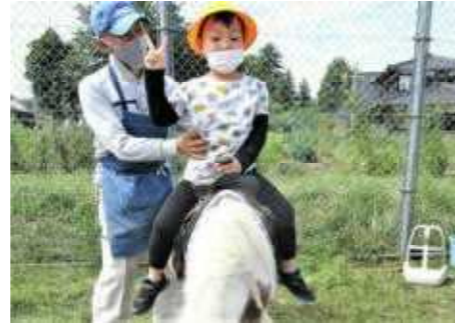
(ポニーに乗っているところ)