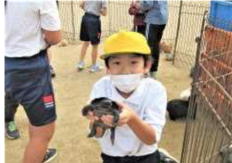
(クサガメを抱いているところ)