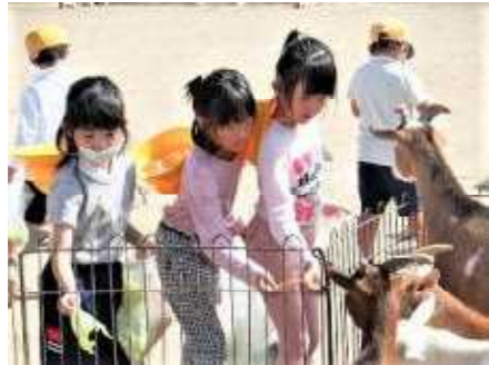
(動物たちに餌やり)

9月29日(木)に、ふれあい動物園を開催しました。アヒル、モルモット、ヤギ、ヒツジ、ウマなどたくさんの動物がエデン牧場からやって来ました。幼稚園・1~3年生の子どもたちは、動物たちを触ったり、ウマに乗せてもらったり、心音を聞かせてもらいました。その後、持ってきた野菜を動物たちに食べさせる等、動物たちと楽しい時間を過ごすことができました。「命の教育」の一環として取り組んだふれあい動物園、子ども達にとって大変良い体験となりました。