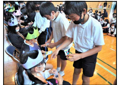
（1年生へプレゼント）

18日（水）、異学年との交流を通して、児童相互の理解を深めるために、全校生で1年生を迎える会を行いました。1年生を迎える会は、1年生へのインタビューや、縦割り班でのゲーム、プレゼント渡しもあり、子どもたちは、みんなとても楽しそうでした。こういった児童の主体的な活動を通して、互いを思いやる気持ちが益々増えることを期待しています。