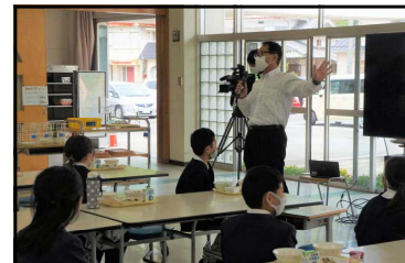
（丹後教育長も来られました）

丹波篠山市で学校給食が始まって今年で65周年です。5月10日の給食記念献立では、「篠山まるごと丼」ができました。「篠山まるごと丼」は、篠山牛や特産の「山の芋」、丹波篠山産の「コシヒカリ」等の地元食材がふんだんに使われたメニューです。城東小学校でも、みんなでおいしくいただきました。また、市の広報の方や、新聞社、テレビ局等たくさんのメディアの方が来られ、多くの子どもたちが取材を受けました。5月25日（水）17時台のサンテレビのニュースでも紹介されるそうです。よかったらご覧ください。